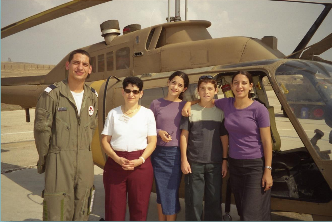
ביקור פורים בטייסר