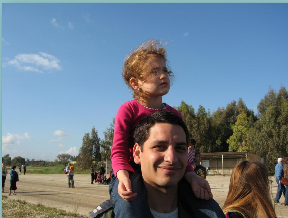
בני ואחייניגא אוריפ