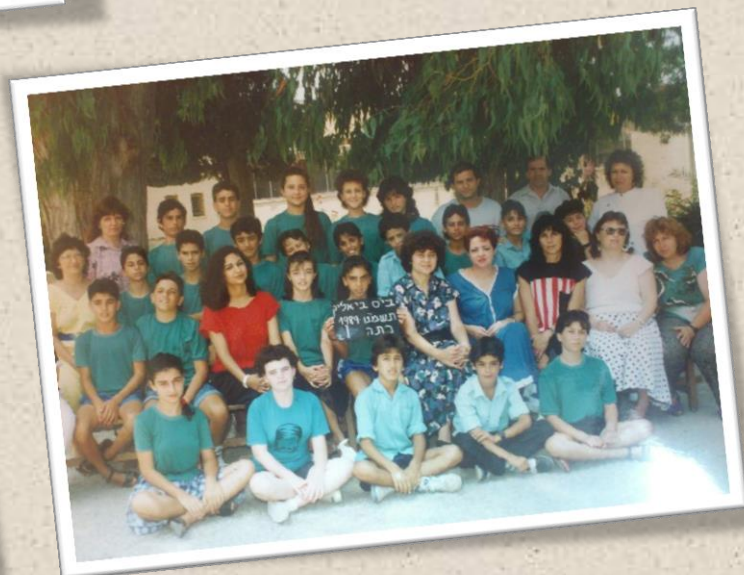
לימור בילדותה, ועם הוריה