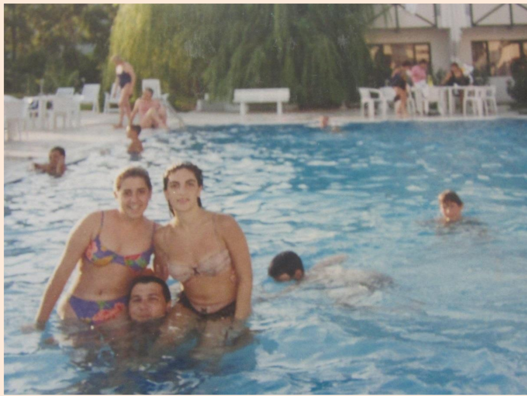
מזכרת מהטיול לחו"ל

במבט לאחור, האם שמחה מאוד שעשתה מאמצים לתת לבתה לנסוע, היא מרגישה שהצליחה לשמח אותה.