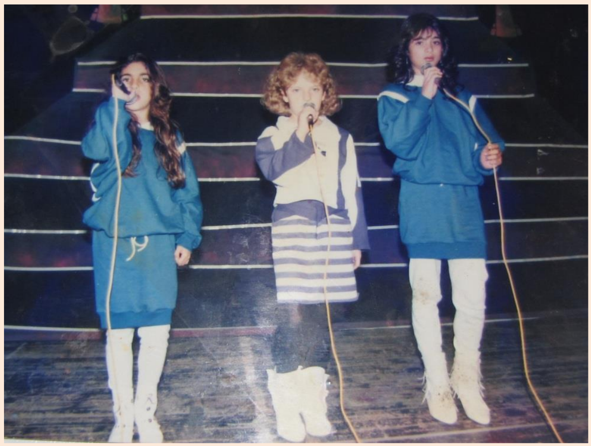
לימור בתחרות כשרונות צעירים